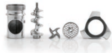
gruppo di macinazione modello ENTERPRISE 12, altri gruppi di macinazione disponibili a pag. 054 mincing groups ENTERPRISE 12 model, other mincing groups available at page 054